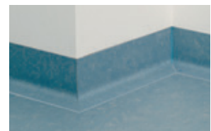
Ahora tendrías que haber obtenido un resultado satisfactorio