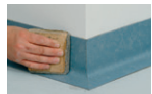
Frotar con cuidado para permitir la adherencia perfecta del adhesivo