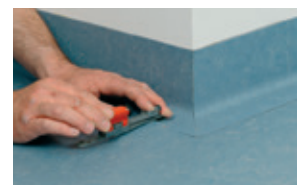
Cortar tiras de material sobrante y soldar con el cordón