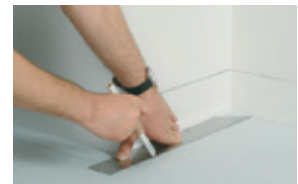
Efectuar el mismo procedimiento para alinear el pavimento