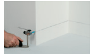
Marcar la pared para posicionar el producto.