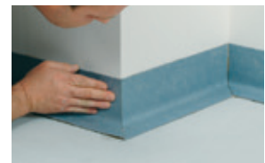
Poner y fijar el rodapié HSLA contado a medida