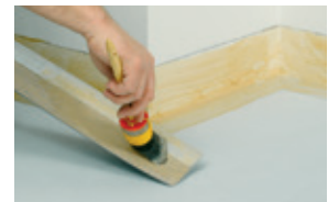
Aplicar el adhesivo de contacto hasta la marca en el pavimento y en la pared